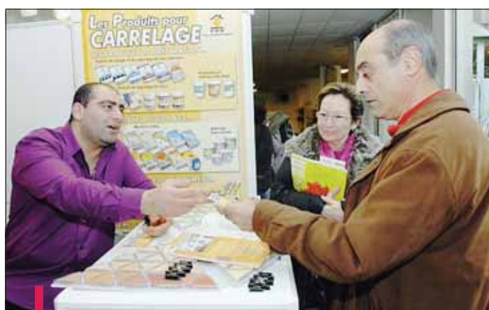
Une cinquantaine de professionnels de la construction répondent aux questions du public.

Le Salon de la maison individuelle organisé par l'Union des maisons françaises (UMF) rassemble jusqu'à ce soir, 19h, au parc Chanot, une cinquantaine d'exposants (entrée gratuite). Le temps pour ceux qui aspirent à un home sweet home de prendre la mesure de leur rêve. Constructeurs, lotisseurs, aménageurs, financiers... les professionnels conseillent le public sur les différentes étapes de l'acquisition d'une maison. Ainsi, Frédéric qui recherche un terrain du côté d'Alaich pour y faire bâtir sa maison. " Je veux un constructeur pour faire une maison avec des matériaux le plus écolo possible ", assure ce primo-accédant. Une attente dans l'air du temps prise en compte dans ce salon avec un pôle "Energies renouvelables" qui regroupe de nombreux professionnels mettant en œuvre les plus ré-