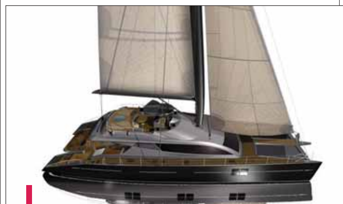
Long de 28,80 m, le "Blue Coast 95" devrait être livré à son heureux propriétaire dans le courant de l'été.

La construction du Blue Coast 95 , sans doute l'un des voiliers catamarans les plus grands et les plus luxueux actuellement en chantier dans le monde, se poursuit à La Ciotat, dans les ateliers de la société H2X. Réalisées en sandwich de fibres de verre, fibres de carbone, mousse PVC et résine époxy selon la technique dite de "l'infusion sous vide", ses deux coques sont aujourd'hui terminées et les ouvriers s'attellent désormais à la mise en place des aménagements intérieurs du navire. Un travail rendu particulièrement délicat et complexe par le fait que le bateau est entièrement "customisé", c'est-à-dire adapté et modifié au fur et à mesure de l'avancement de sa construction et des desirata du client.